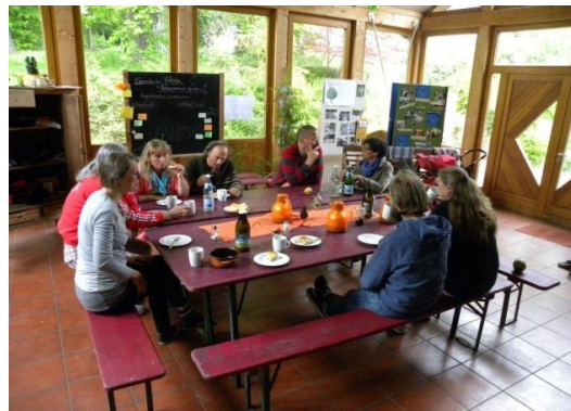
Seminarpause bei den gASTWERKen

www.lossehof.de www.gastwerke.de www.villa-locomuna.de www.lebensbogen.org www.kommune-niederkaufungen.de