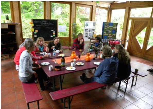
Seminarpause bei den gASTWERKEn