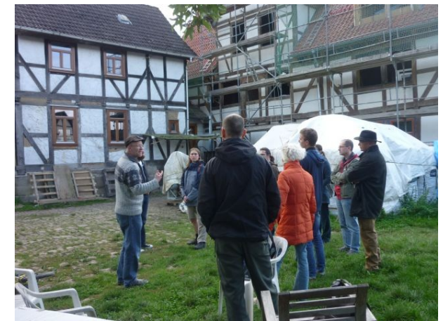
Seminargruppe auf dem Lossehof

Die sechs Kommunen sind Teil des Netzwerkes der politischen Kommunen „KommuJa“. Infos über das KommuJa-Netzwerk gibt es im Netz unter: www.Kommuja.de